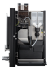
OB 3 (XL) NG