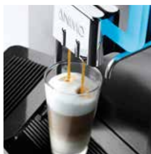
+ Un'ampia scelta di bevande a base di caffè come ad esempio il latte macchiato