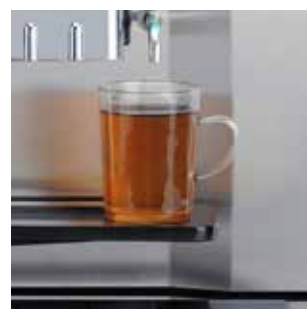
+ Erogatori separati per caffè e acqua calda