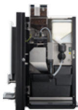
OB 2 (XL) NG