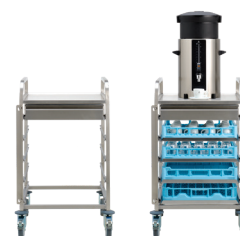
SERVEERWAGEN CAFÉCRUISER DE LUXE (Max. 1 container, 20 l)