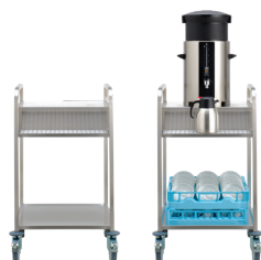
SERVEERWAGEN CAFÉCRUISER ONE (Max. 1 container, 20 l)