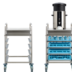
SERVEERWAGEN CAFÉCRUISER REGAL (Max. 1 container, 20 l)