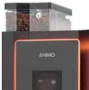
+ Des grains de café frais