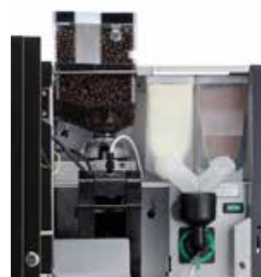
+ OptiBean 3, 1 mélangeur et 2 bac à produits instantanés