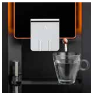
+ Sortie séparée pour l'eau chaude