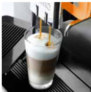
+ De nombreuses variétés de boissons, comme le Latte Macchiato