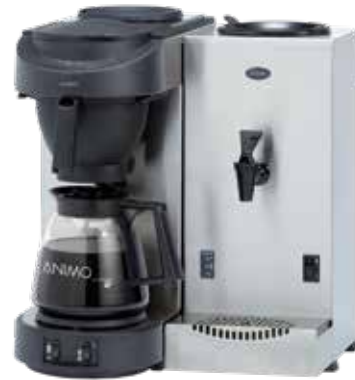
M100 mit WKT3

Ideal, um Thermoskannen und schwer zugängliche Stellen zu reinigen.