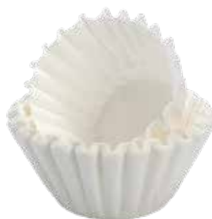
Papier corbeille filtre