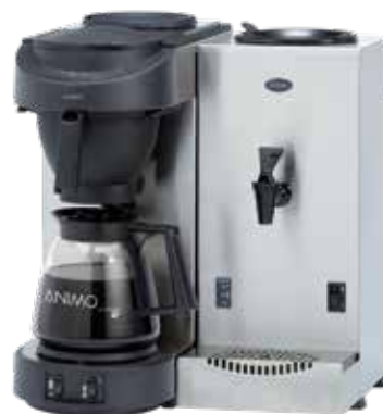
M100 avec WKT3

Idéal pour nettoyer les bouteilles thermos et les endroits difficilement accessibles.